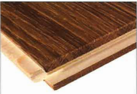
Verlegesystem Nut & Feder

Der Gegenzug. Besteht wahlweise aus Laubholz oder aus Nadelholz und sorgt so für ein ausbalanciertes Kräfteverhältnis.