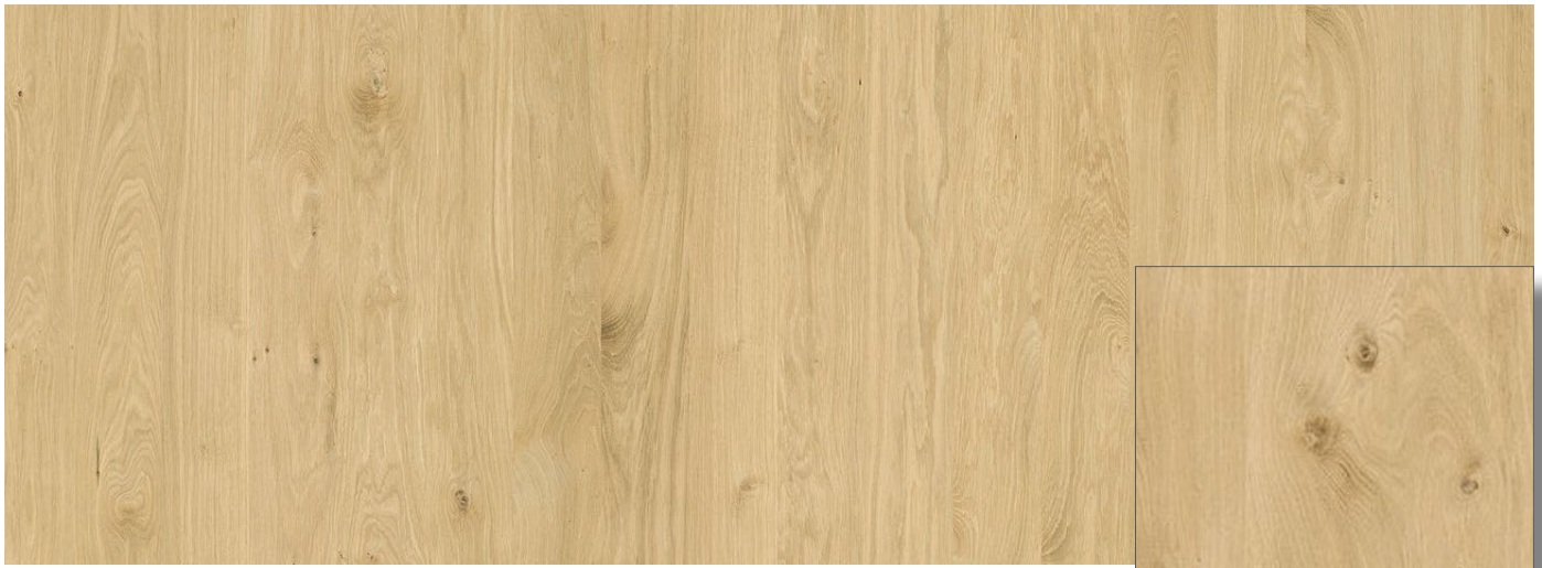
Die Abbildung zeigt ein exemplarisches Erscheinungsbild.

C: Im Prinzip ohne Qualitätsanspruch. Fehlstellen nicht gekittet.