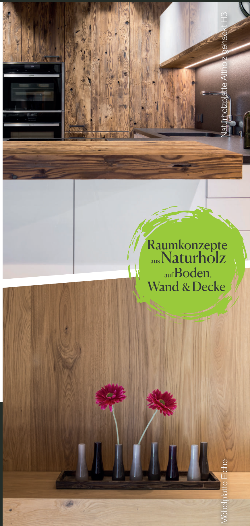
Naturholzplatte Altholz gehackt H3

Raumkonzepte aus Naturholz auf Boden, Wand & Decke