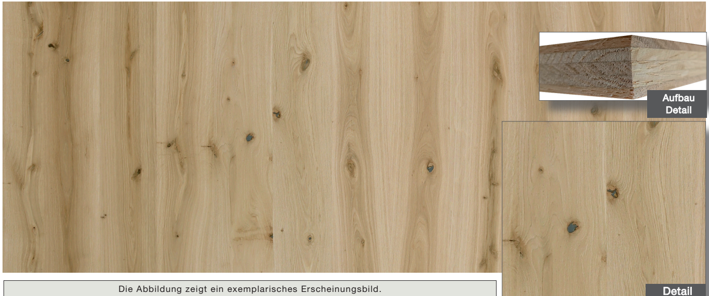
Die Abbildung zeigt ein exemplarisches Erscheinungsbild.

R: Schlichtes und gefladertes Holzbild, gesunde, schwarze und Flügeläste zulässig, Astausbrüche und Astrisse dem rustikalen Erscheinungsbild entsprechend fachmännisch ausgebessert, ohne Splint, Risse, Kern, Mark sowie partielle Rindeneinwüchse und Wurmstiche für ein rustikales Erscheinungsbild zulässig, wuchs- und holzspezifische Farb- und Strukturunterschiede mit betonend rustikalem Farbspiel sind möglich, fugendichte Verleimung.